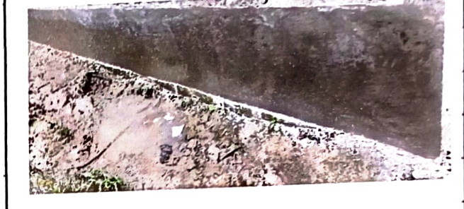
Foto 2: 100% de reparaciones de alisado de paredes en las partes bajas contra la humedad en las afueras de las aulas .