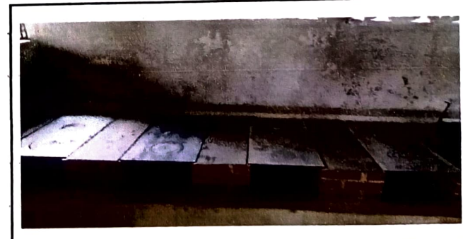
Foto 6: 100 % de reparación de polletones e instalaciones de las planchas de la cocina.

Observación: Si es necesario se pueden agregar fotos adicionales y actualizar el número de hojas.