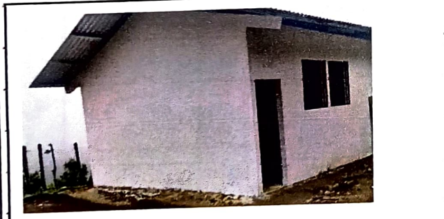
Foto 3: 100% de reparación de repellido de paredes de las afueras de cada una de las aulas.