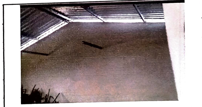
Foto 4: 100% de reparación de repellido de paredes dentro de cada una de las aulas.